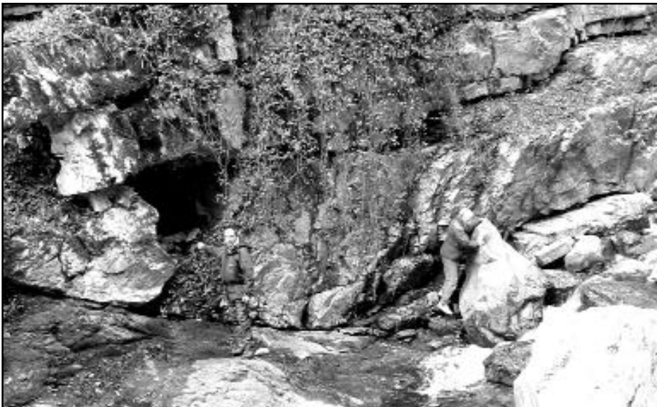
Risorgenza Palazzolo 1268 Li/SP - Ingresso.

Con un dislivello in leggerissima salita, è