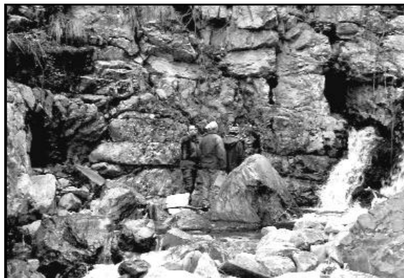
1268 Li/SP a sinistra - 1266 Li/SP a destra.