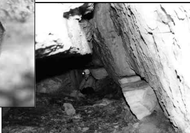
Tanna de Foe - sulla destra "la panchina".