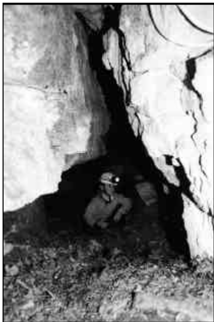
Tanna de Foe - ingresso.