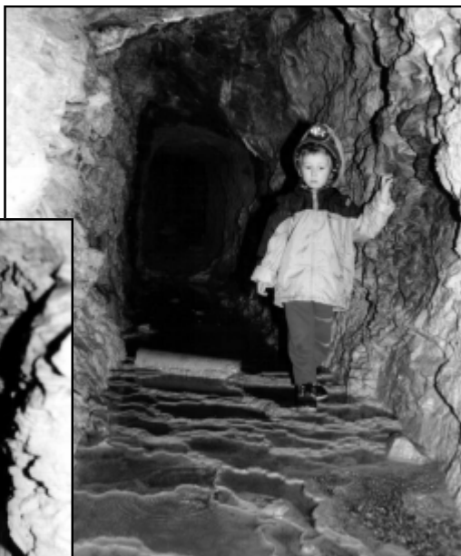
Grotta di Camascenza - Vaschette.