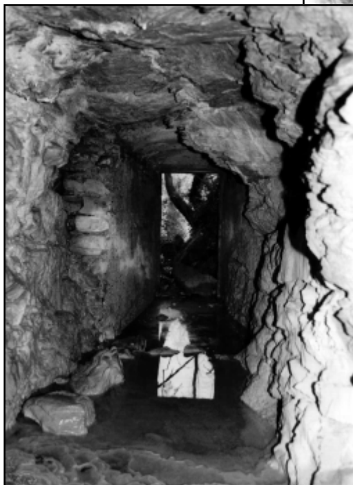
Grotta di Camascenza - Interno.