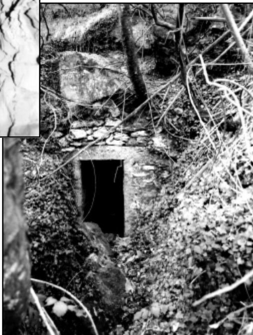
Grotta di Camascenza - Ingresso.